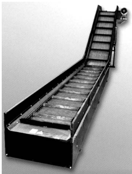
Trasportatore per evacuazione trucioli di grosso spessore Conveyor for evacuation of large thickness scraps