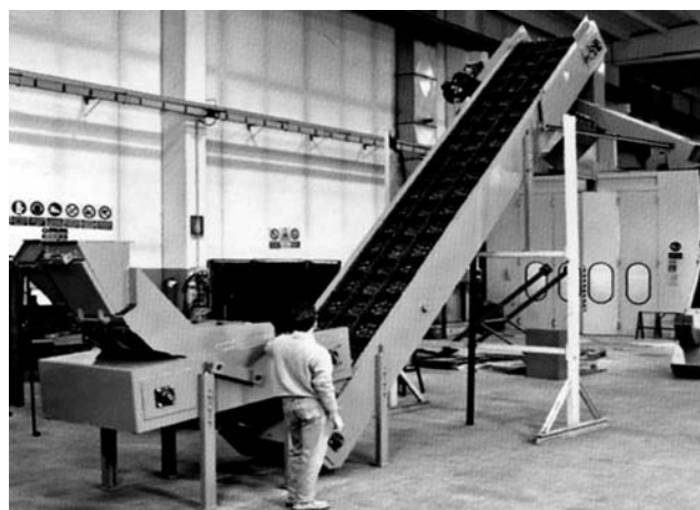
Trasportatore per evacuazione pezzi stampati a caldo su piste separate Conveyor for evacuation of drop-forged pieces on separated tracks