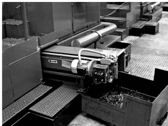
Trasportatore rettilineo per estrazione sfridi da stampatrice Rectilinear conveyor for extraction of scraps from cold header